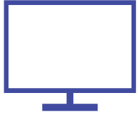
SYSTÈME D'INFORMATION ERP - TMS